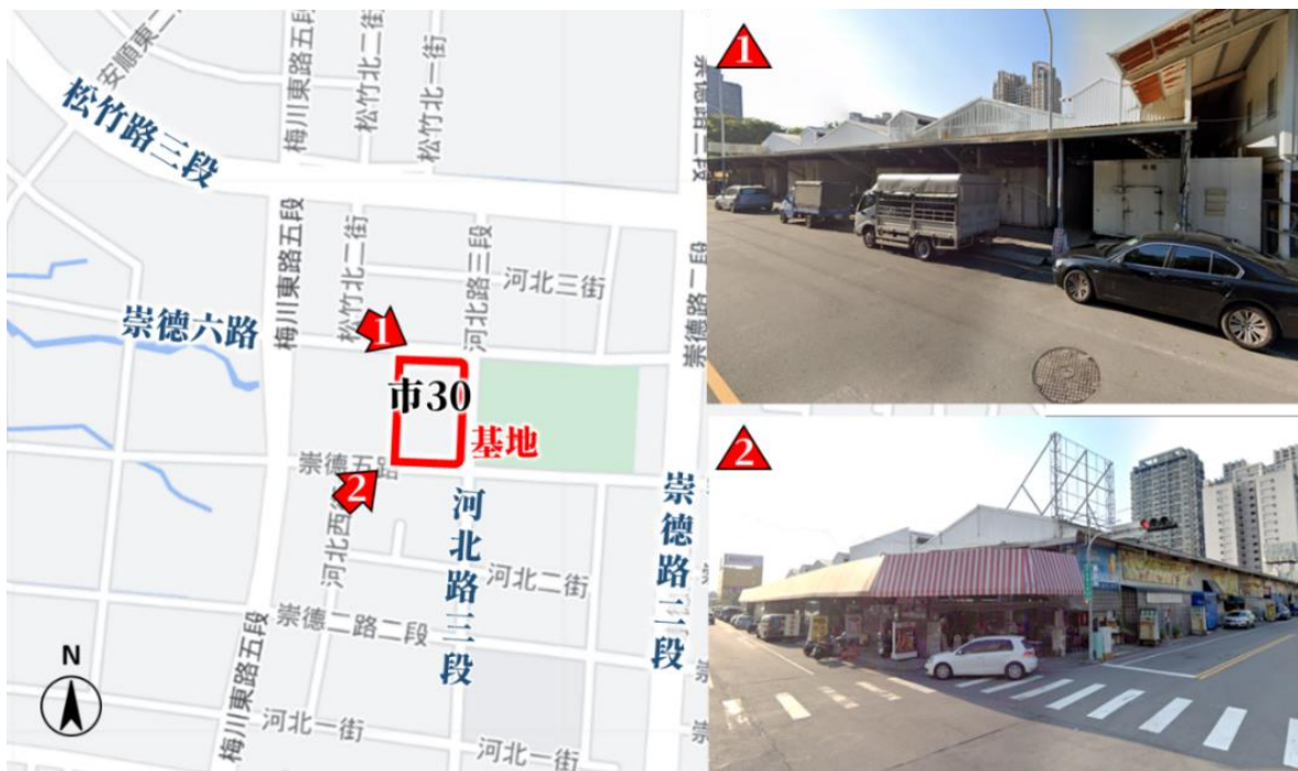
圖 1：本案基地區位示意圖