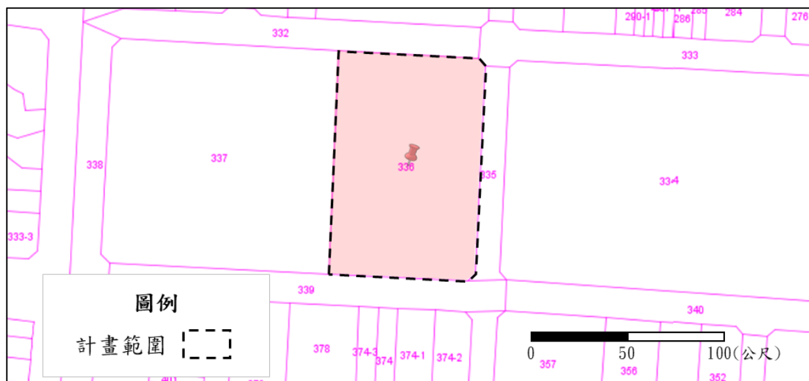
圖 2 基地地籍示意圖