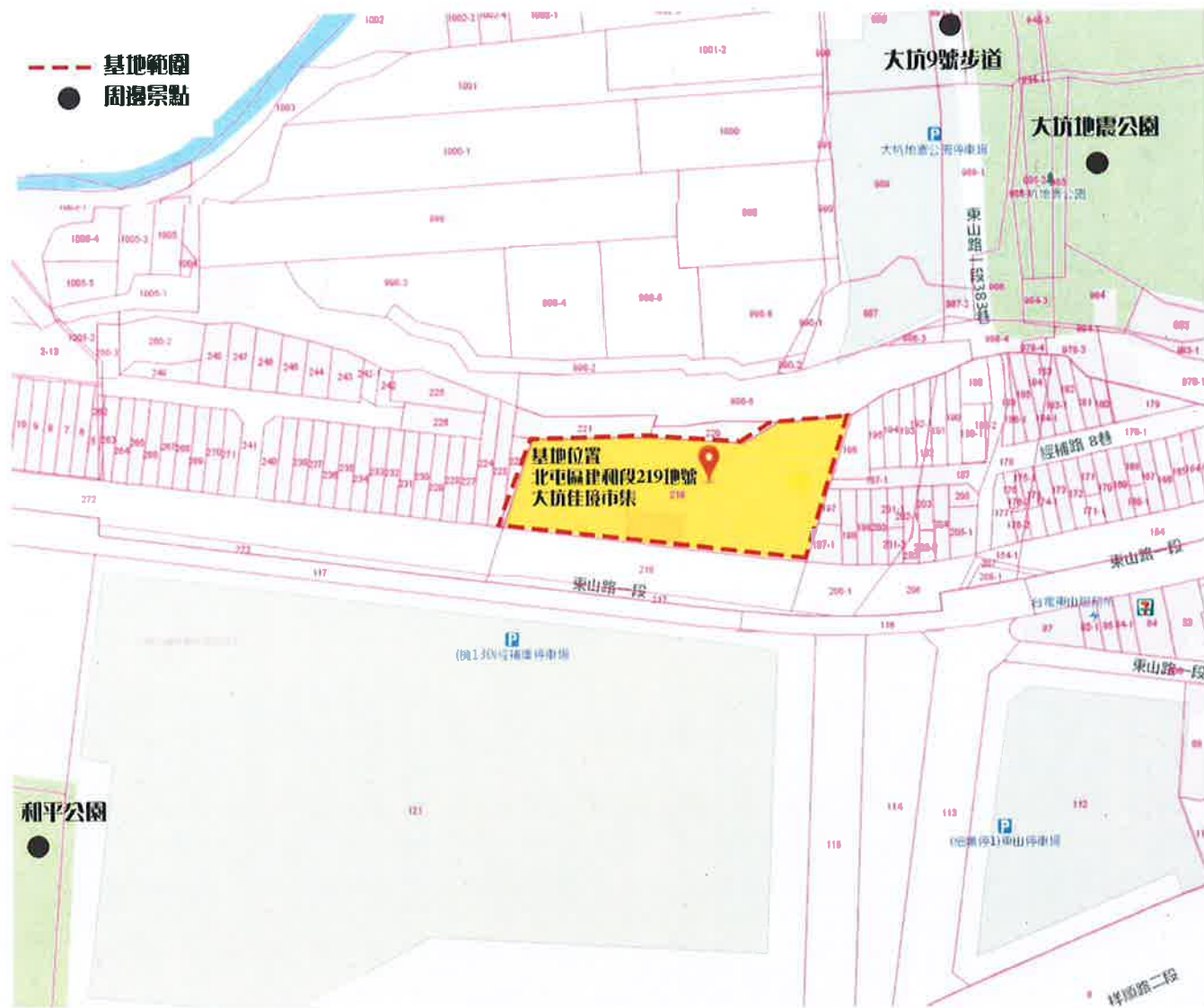
附圖一 攤販集中區範圍位置圖