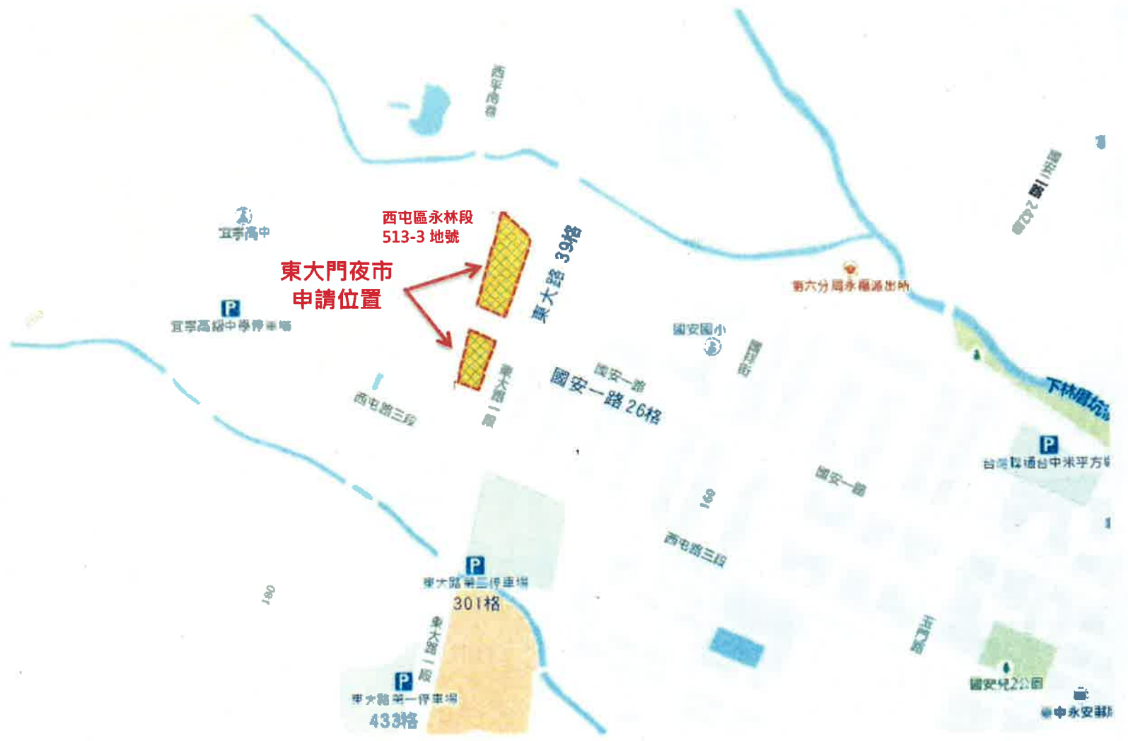
東大門夜市位置圖