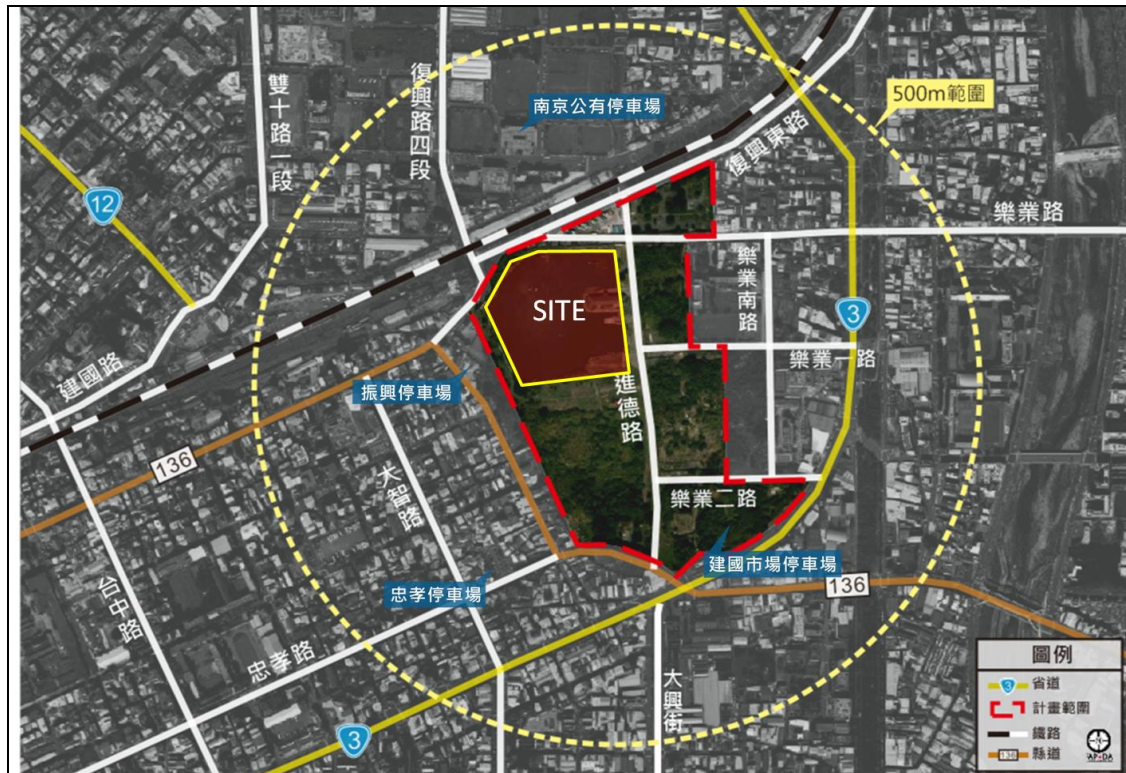
圖 3-5 計畫範圍周邊停車設施示意圖

計畫區內道路系統以南北向的進德路為主，輔以東西向的樂業路、樂業一路、樂業二路，銜接連通至建成路、復興路。