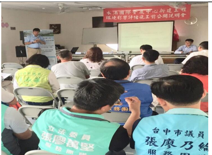
主席致詞及開發單位簡報 2