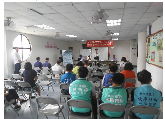
開發單位與里民意見溝通 3