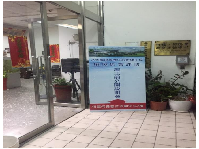
臺中市西屯區何福、何德聯合活動中心(臺中市西屯區河南路一段 125 號 3 樓)