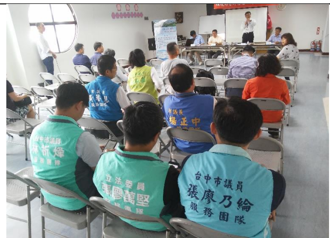
開發單位與里民意見溝通 1