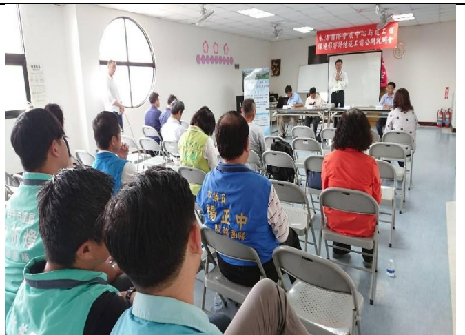
簽到 3、主席致詞及開發單位簡報 1