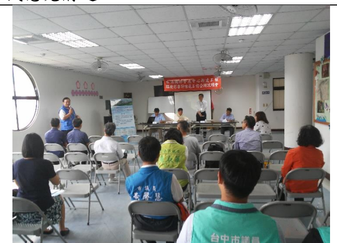
開發單位與里民意見溝通 2