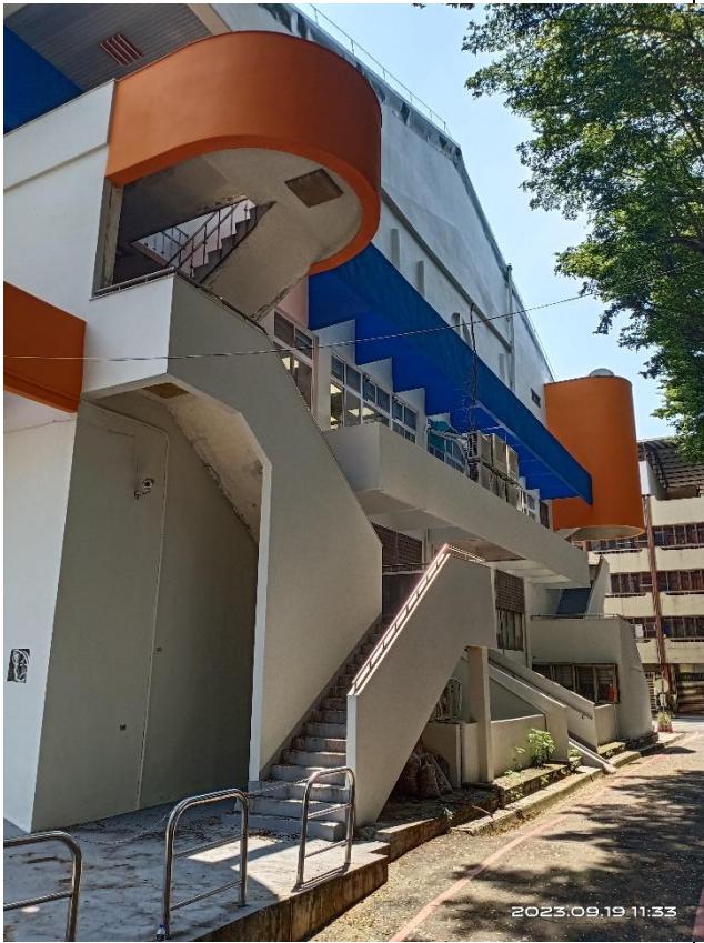
市場西側室外逃生梯