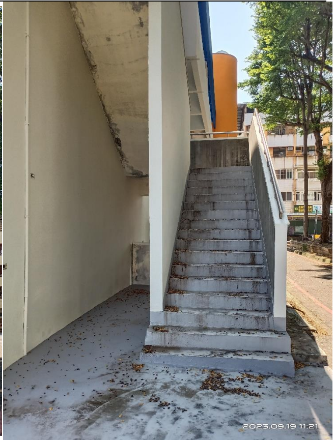
市場西側室外逃生梯出入口