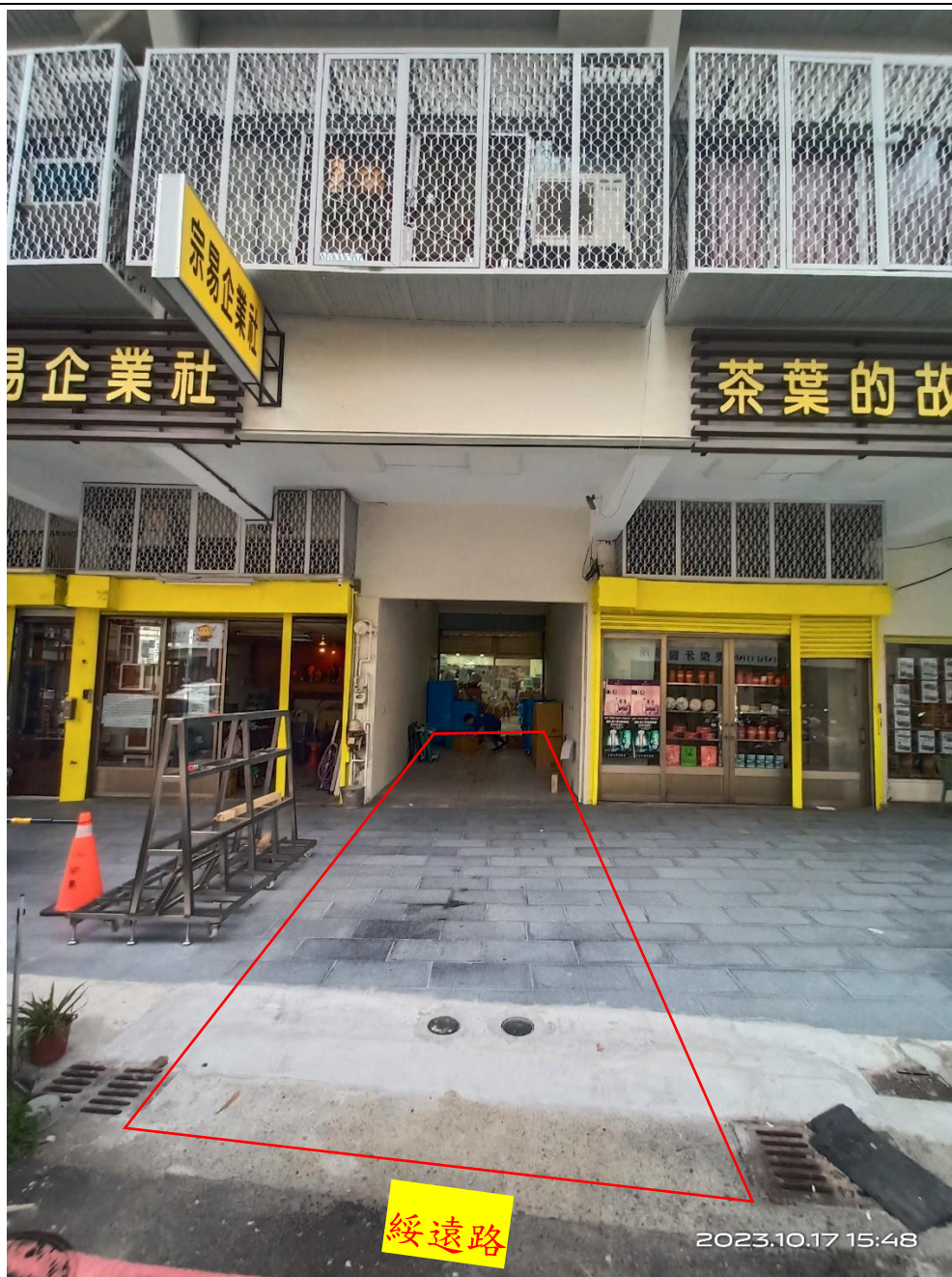
1樓攤位區臨綏遠路卸貨通道(紅框)