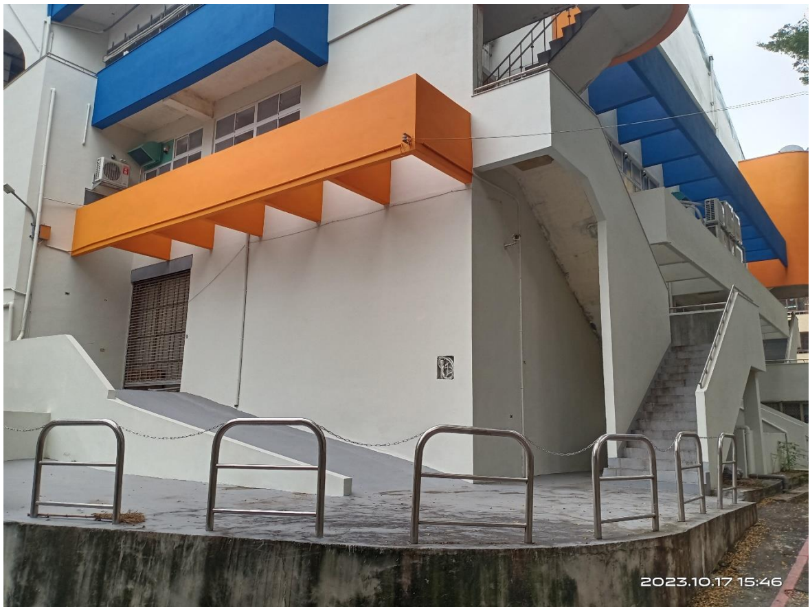
市場西側室外逃生梯出入口水泥鋪面