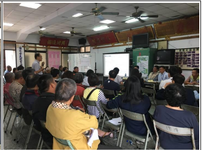
主席致詞及開發單位簡報