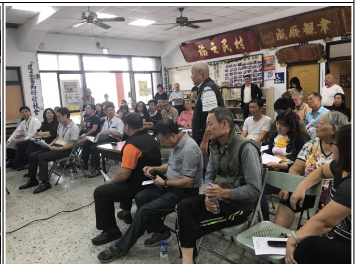
意見交流及回覆說明 2