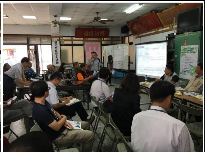
意見交流及回覆說明 1