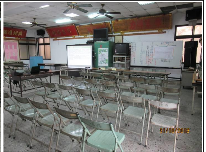
臺中市太平區德隆里活動中心(臺中市太平區德興街 136 巷 178 號)